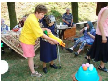
Strieľanie na loptičky na výlete